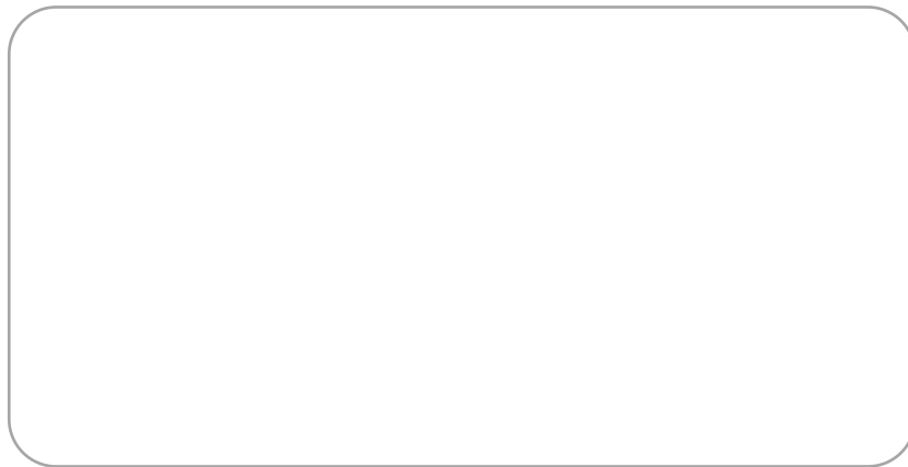
Сталкивающиеся пластилиновые шарики

Импульс тела p (кг*м/с)-векторная физическая величина, равная произведению массы тела на его скорость